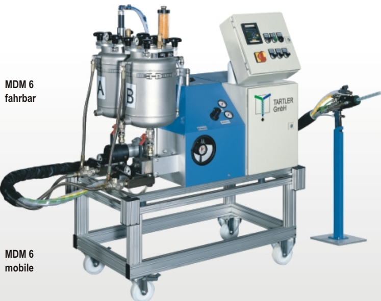
MDM 6 fahrbar